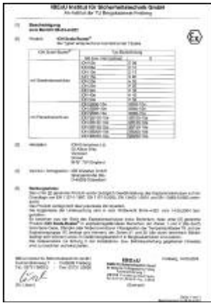
Certifikát pro jednotlivé typy