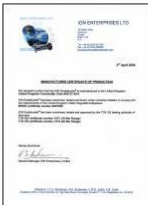
Manufactures certificate of Production