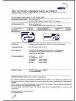
RWTÜV osvědčení č. 1571/03