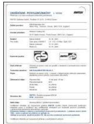
RWTÜV osvědčení (překlad)