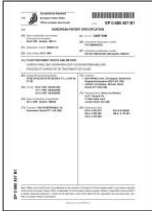
Výpis z patentů pro Evropu