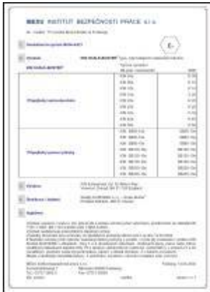
Certifikát pro jednotlivé typy