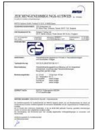
RWTÜV osvědčení č. 1572/03