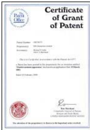
Certificate of Grant of Patent