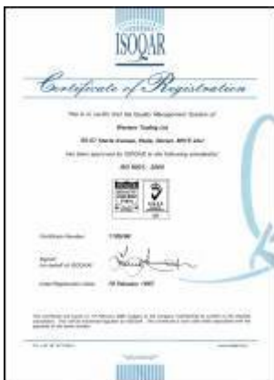
Certifikát splnění směrnice ISO 9001:2000